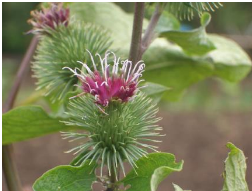
広町の畑で 2007年8月31日