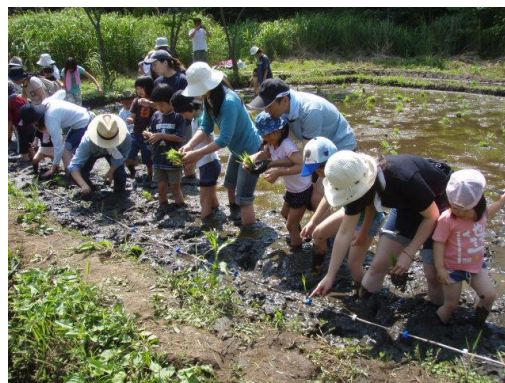
去年は354人が参加した＝6月6日

泥まみれになって、植物のたくましい生命力に触れる。その喜びを、市民の皆さんと共有したいと考え、「田植え祭」と名づけて、参加を呼びかけています。