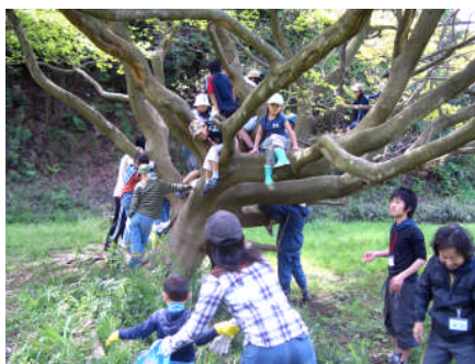
植え付けが終わって木登り