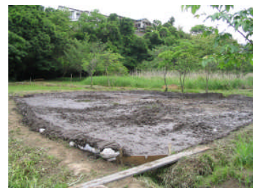
田植えの準備が着々と

田んぼには、ツバメが飛んでおり、そばの水路沿いにタノコアシが、ことしもたくさん生えています。