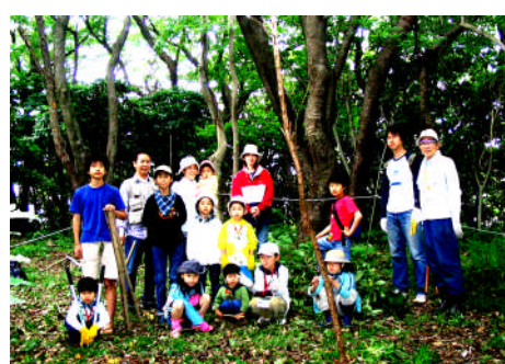
ウサギ山のサクラの下