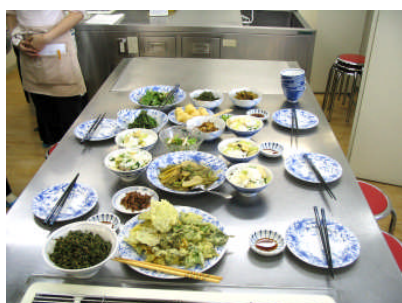
ずらりと揃った料理

は意外と早く終わりました。また捨てるものの無いというタンポポの料理（花はてんぷら。茎は茹でて冷水にさらし、竹輪と味噌を加えて梅肉和え。葉は、かりかりベーコンとフレンチドレッシングでサラダ）に感心しました。