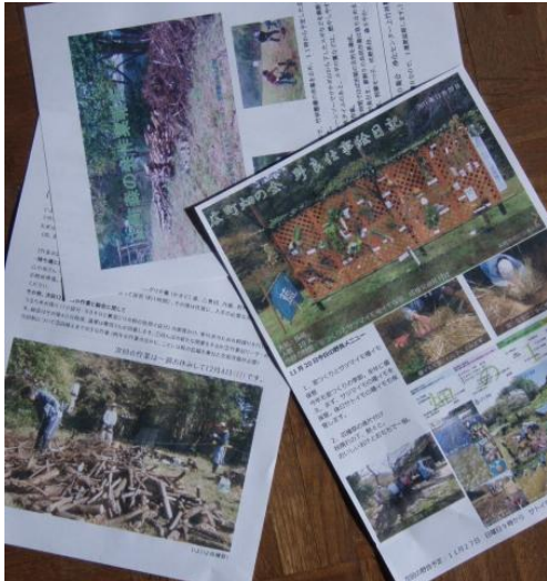
上から時計回りに、森、畑、 田んぼの会の作業報告

報告のタイトルや日付をその写真にはめこみ、会の内部向けでなく、市民に向かってアピールするビジュアルな仕立てです。