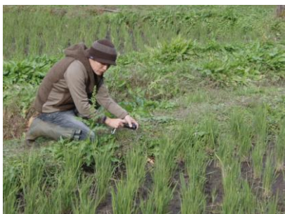
稲刈り跡にもクモやトンボが

1年のつもりだった「生き物図鑑」は、3年が過ぎても、完成しないが、気にならない。