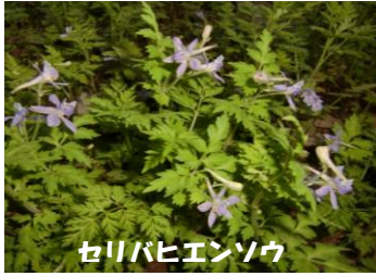
セリバヒエンソウ