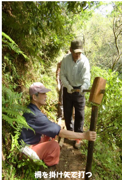
柵を掛け矢で打つ