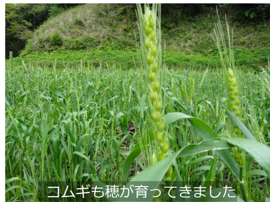
コムギも穂が育ってきました