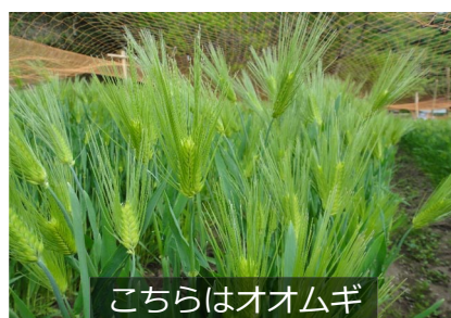
こちらはオオムギ

2. オオムギ、コムギに穂が大きくなってきましたよ。コムギにもネット用の支柱を立てました。又マルチを兼ね堆肥を畝間に