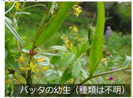
バッタの幼生（種類は不明）

次回の野良予定：5月7日（日曜日9時から どなたでも参加できます！） メニューは、しいたけそだ木配置、ネット張り、種撒きなどです。