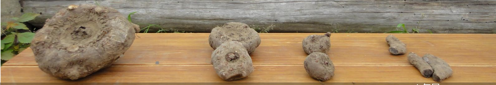
いつ：5月1日 4年目 3年目 2年目 1年目 天気：曇り。コンニャクの種イモ。収穫まで最低でも4年かかります。

人数：総勢7名 今日の野良：コンニャク植え付け、綿種まき、コムギ畑に堆肥とネット用の支柱設置、しいたけ菌駒打ち込み、雑草取り（始まりました2011年雑草との戦い）