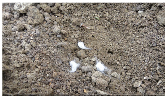
綿の種です。白いもちゃもちゃが綿花を取った残りの部分。中に種があります

4. シイタケ菌駒打ち込み。 新しいく加えるホダ木に菌駒を打ち込みました。(写真がなくて番外。オケラだってバッタだって！友達なんだー！ごめんなさい)